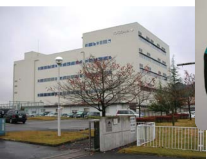
所在地: 東京都あきる野市小峰台2番地